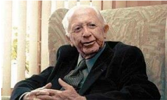
Pionero de la Neurología en Colombia

Ha sido catedrático de neurología y neurofisiología en las universidades Nacional, Javeriana, el Rosario y el Bosque. Ha incursionado en áreas de la pediatría, neurología, psicología, ortopedia y gerontología.