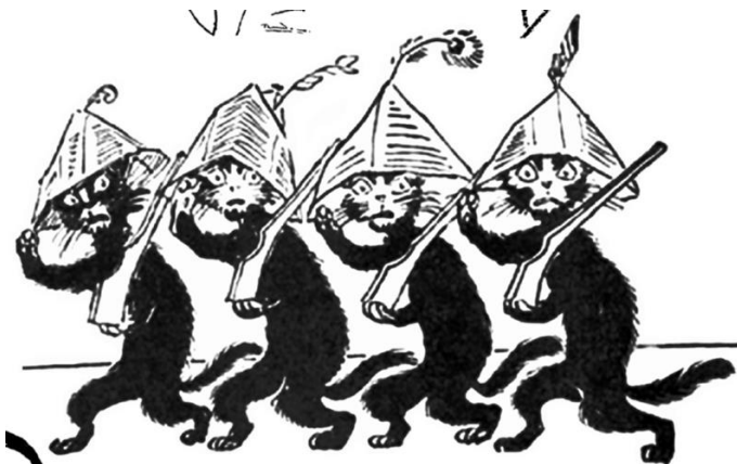
Caricatura a “Los Leopardos”, del famoso caricaturista Ricardo Rendón

“Era el más Leopardo, hasta en lo físico: con sus movimientos felinos y sus gestos nerviosos, con las frases que soltaba como un zarpazo. Fue también el más combativo hasta el final y el que escribió la historia del grupo. Utilizó la altanería y el desdén como arma en las controversias parlamentarias, en la prensa y las conversaciones privadas... Amó a Colombia con delirio y, como Villegas, encarnó toda una larga etapa de nuestra vida política... Ahora hacen falta en el panorama nacional personajes de esta clase; el vacío se nota. Con el leopardo más leopardo se enterró una leyenda, pero también una historia verdadera de valor civil y de arrogancia ciudadana”. - Carlos Lleras Restrepo.