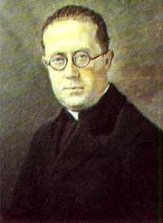
Oleo de Francisco Antonio Cano, 1929

Posterior a su reconocimiento por el Premio Nacional de Ciencias en 1955, se le otorgó la Medalla de Oro a una vida dedicada a las ciencias en el más alto nivel, como homenaje póstumo, en 1988. Fue condecorado con la Cruz de Boyacá en el grado de Caballero, y en Venezuela, con la Orden del Libertador.