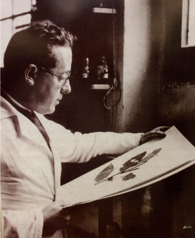
En el Herbario Nacional

Fue miembro fundador de la Academia Colombiana de Ciencias Exactas, Físicas y Naturales en 1933 (hay otros bartolinos miembros fundadores). Representante por Colombia a la primera reunión de botánica en Suramérica, en 1938. En la primera reunión en la que Colombia asistió a la UNESCO en 1947, dio a conocer a las entidades científicas y educativas un Directorio Colombiano de ciencias naturales de Colombia, lo que le repercutió en pasar a ser parte del grupo de investigación por la UNESCO de la Hilea Amazónica (floresta) junto con investigadores de varios países.