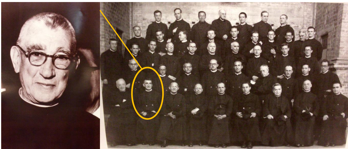
Foto de la Comunidad Javeriana y de San Bartolomé. Noviembre de 1940, poco antes de entregar el antiguo claustro al Ministerio de Educación