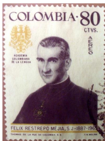
Estampilla Conmemorativa 1965