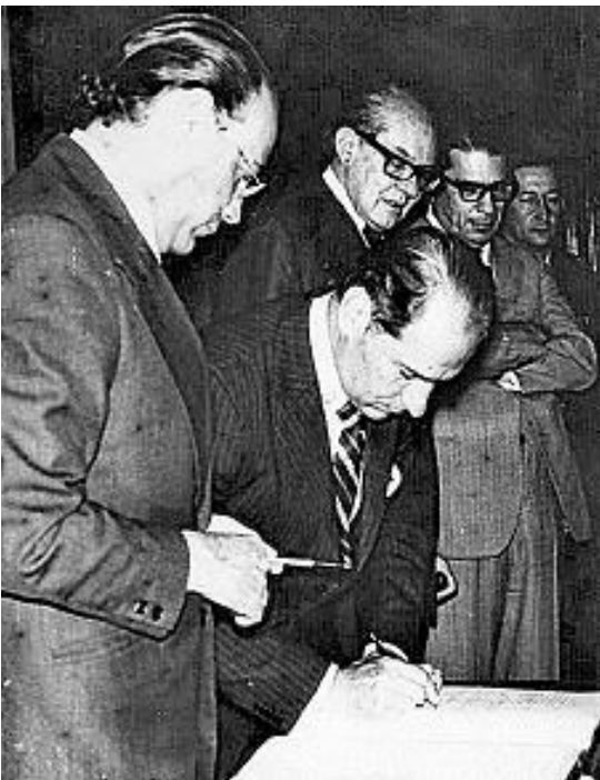
En su posesión como Ministro de Minas y Petróleos, Agosto 15 de 1962

Gracias a su gestión, como comisionado por el Consejo Nacional de Petróleos, se logró la reversión de la Concesión de Mares al Estado, en 1951, que hasta dicho momento había sido manejada por la Tropical Oil Company. Esto permitió que la naciente empresa Ecopetrol quedara a cargo y comenzara su incipiente organización técnica, administrativa y financiera. El Presidente Laureano Gómez (también Bartolino), mediante decreto, terminó dándole vida jurídica a dicha empresa.