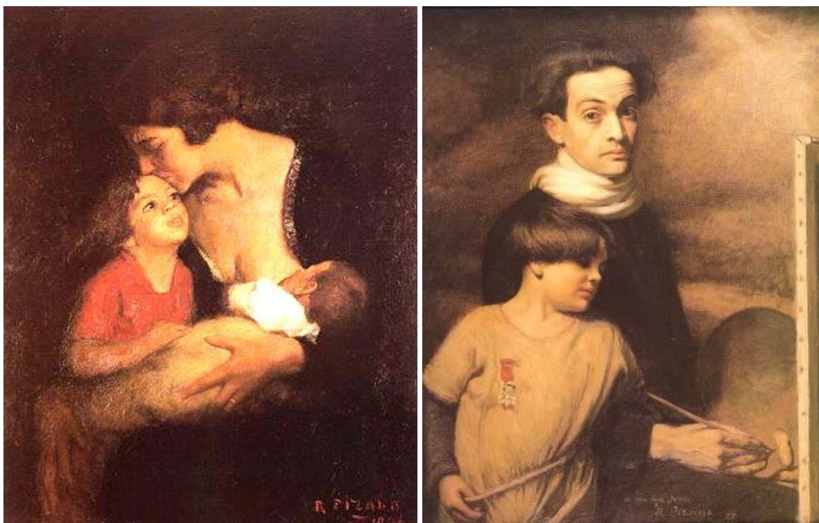
La Maternidad y Autorretrato con su hijo Juan, dos de sus cuadros más admirados.

Con su óleo "Mujer", obtiene uno de los primeros premios en la Exposición de Bellas Artes de Bogotá en 1926. Con el óleo "Maternidad" gana el premio de primera clase en el Salón de Artistas Franceses, lo que le permite exponer cuatro cuadros, todos los años, sin necesidad de ser aprobados por el jurado de admisión; y también gana el diploma de honor en la Exposición Internacional de Burdeos en 1927.