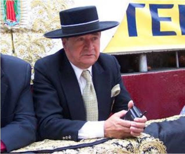
Devoto seguidor de la Tauromaquia